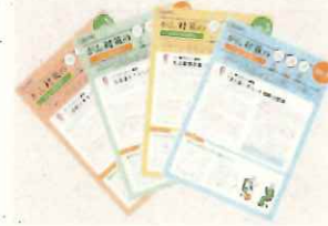
毎月最新の情報をNewsとしてお届け