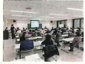
特別講師によるオンライン・オフライン無料研修