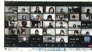
企業同士の情報交換オンライン会議の様子