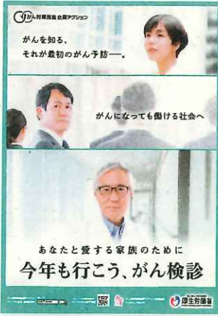
社内掲出用のポスターを無料でプレゼント

無料でも、ここまでできる会社のがん対策！ 「がん対策推進企業アクション」に登録しましょう。