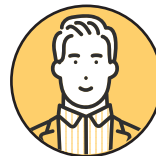
キャリア コンサルタント