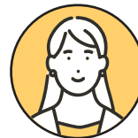
働き方改革 コンサルタント