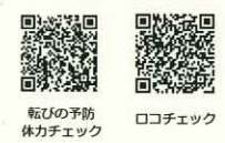
転びの予防 体力チェック ロコチェック